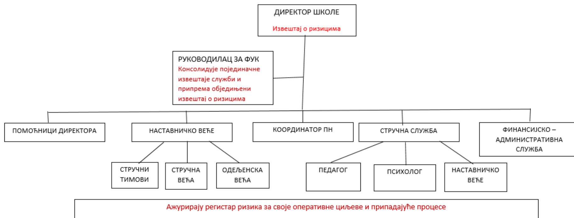
Слика 3. Шематски приказ процеса извештавања о ризицима Економско трговинске школе у Смедереву