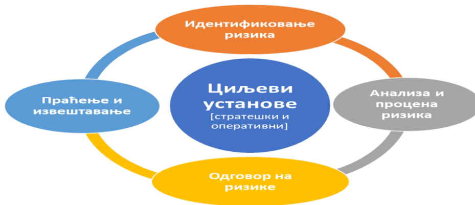
Слика 2. Процес управљања ризицима

Процес управљања ризицима састоји из четири основна корака која се примењују и на стратешке и на оперативне ризике: 1) идентификација ризика; 2) анализа и процена ризика; 3) одговор на ризике; и 4) праћење и извештавање.